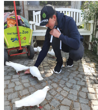
Impressionen des Besuch im Affen- und Vogelparks in Eckenhagen