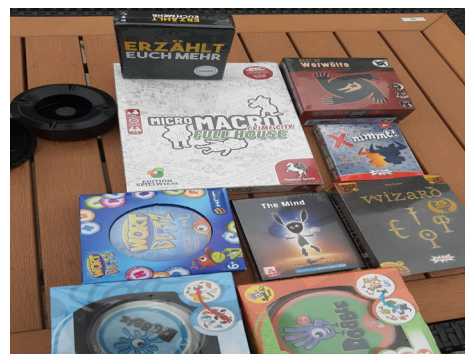
Wir lernen uns gemeinsam spielerisch kennen und bauen so eine Beziehung zueinander auf