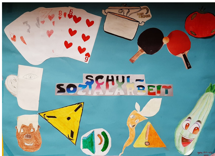
Eine unserer Klassen hat ein Türschild für das Schulsozialarbeiter-Büro entworfen