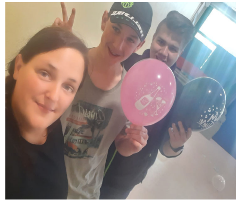
Gemeinsame Klassenfeier und Abschlussfeier der Klasse 10